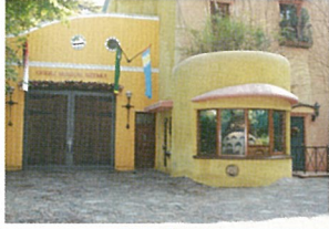
三鷹の森 ジブリ美術館