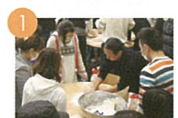
1 餃子パーティー 만두파티 餃子宴會 Spring Festival (Dumpling Party)