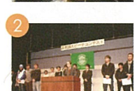
2 スピーチコンテスト 스피치 콘테스트 日本語演講比賽 Speech Contest