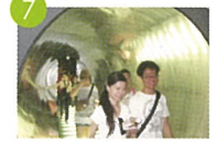
7 ビール工場見学 맥주공장견학 啤酒工廠參觀 A Tour of Beer Factory