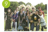
9 神代植物公園 진다이식물공원 神代植物公園參觀 Jindai Botanical Gardens