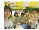
MISHOPフェスティバル MISHOP 국제교류 페스티벌 MISHOP 國際交流節 Mitaka International Exchange Festival