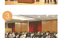
3 卒業式 졸업식 畢業典禮 Graduation Ceremony