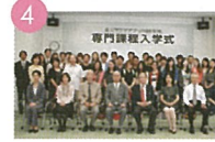
4 入学式 입학식 入學典禮 Admission

과외활동 / 課外活動 / Extracurricular Activities