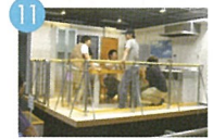
11 立川防災館 다치카와 방재관 견학 立川防災館體驗 Tachikawa Life Safety Learning Center