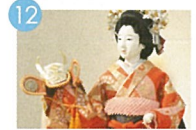
12 文楽教室 분라쿠 교실 日本木偶淨瑠璃戲體驗 A Tour of Bunraku Puppet Show