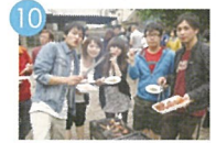
10 BBQパーティー BBQ파티 燒烤宴會 Barbecue Party