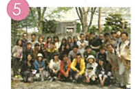
5 高尾山ハイキング 다카오산 하이킹 高尾山踏青 Go on a Hike to Mt. Takao