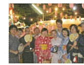
盆踊り 봉오노리 孟蘭盆舞蹈 Bon dance (Summer Festival)